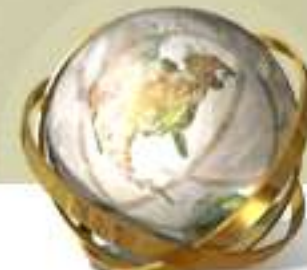
Balança Comercial Brasileira Balanza Comercial Brasileña / Brazilian Trade Balance US$ Milhões / US$ Millones / US$ Million - 2014/2013