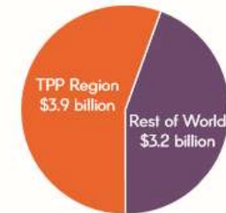
U.S. Beef Exports, 2014 Total = $7.1 billion